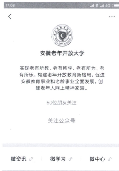
图 5 搜索并关注公众号

(2) 点击公众号下方“微学习”，进入资源中心，根据兴趣爱好选择课程，开始学习。如图 6 所示