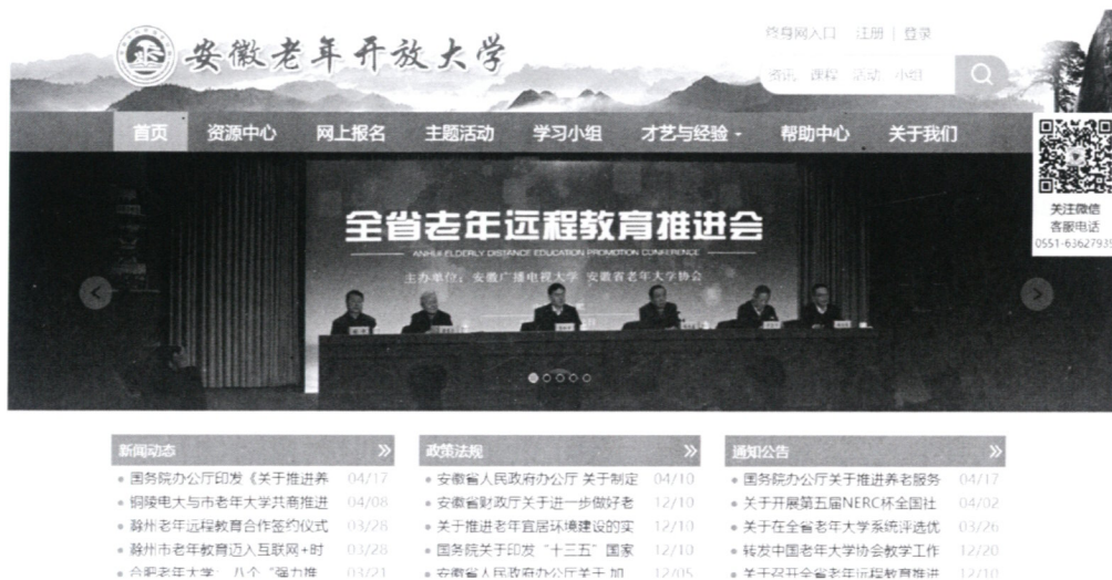
图 1 安徽老年开放大学网首页

(1) 打开浏览器，输入网址： www.ahlnjy.cn ，（“安徽老年教育”拼音缩写）或百度搜索“安徽老年开放大学”，进入安徽老年开放大学网首页。如图 1 所示