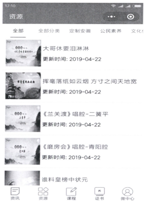
图 6 资源中心

(2) 点击公众号下方“微学习”，进入资源中心，根据兴趣爱好选择课程，开始学习。如图 6 所示